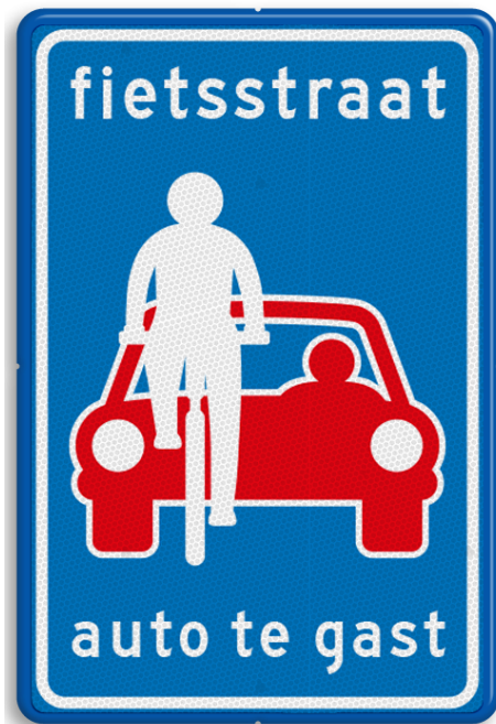
Afbeelding 1: verkeersbord auto te gast